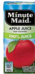
DRINK BOXES CAJAS DE JUGO