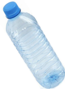
PLASTICS PLÁSTICO #1-5