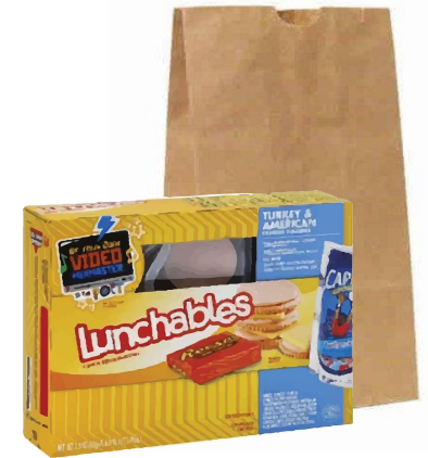
CLEAN PAPER & CARDBOARD CARTÓN Y PAPEL LIMPIO