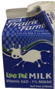
MILK CARTONS CARTONES DE LECHE

ALL CONTAINERS MUST BE EMPTY TODOS CONTENEDORES DEBEN ESTAR VACÍOS